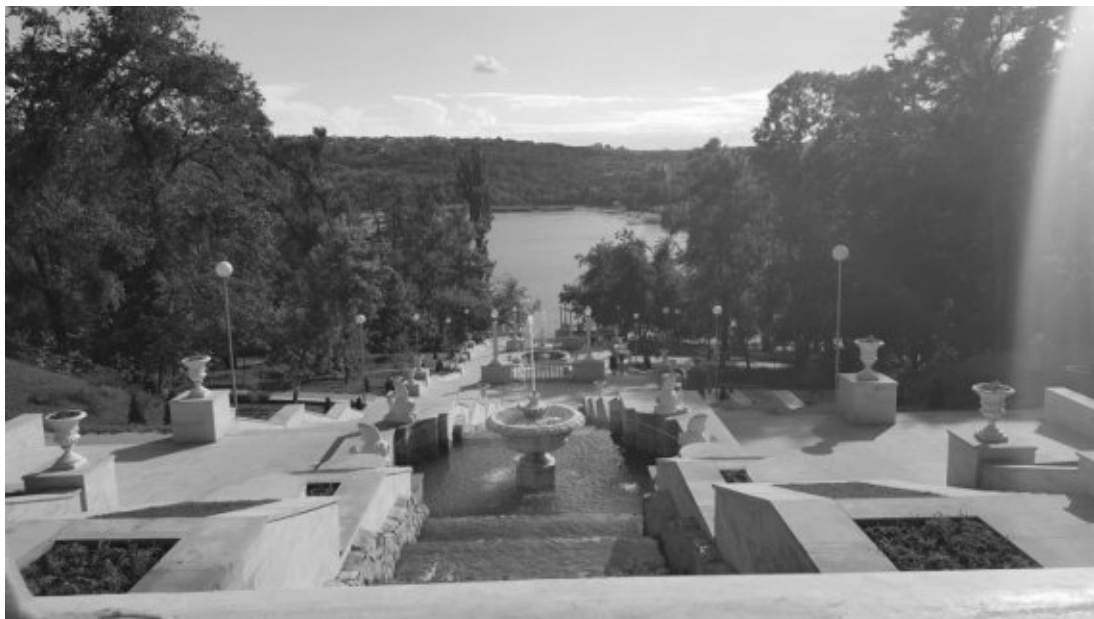
Valea Morilor Park mit See in Chişinău

Bahnhof von Chişinău vor dem Besteigen des Zuges einem Moldawischen Zollbeamten unsere Pässe vorweisen mussten und er uns die Pässe mit den Worten „Good Luck“ zurückgab, wurde das mulmige Gefühl im Bauch noch etwas grösser. Schlussendlich war es dann aber so, dass wir von Transnistrien gar nichts mitbekommen hätten, wenn wir uns dessen nicht bewusst gewesen wären, dass sich da zwischen Moldawien und der Ukraine