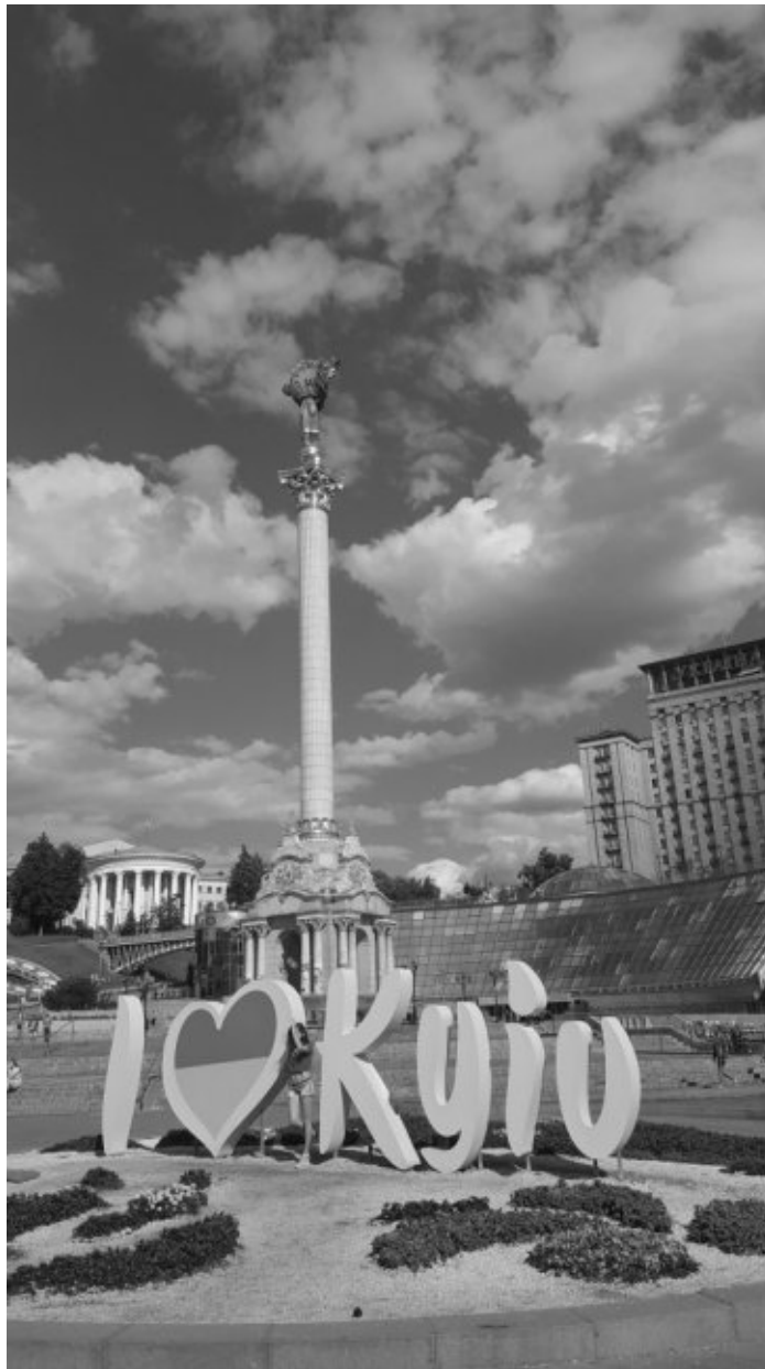
Der Maidan-Platz in Kiew

Schwarzen Meer ist Odessa ein beliebtes Urlaubsziel für die ukrainische Mittel- und Oberschicht aber auch immer noch für Russen. Man findet daher auch unweit des Stadtzentrums einen schönen Sandstrand gesäumt mit zahlreichen Cafés und Restaurants.