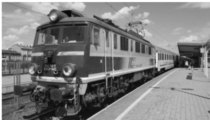
Wieder Normalspur: Der PKP-Intercity Przemyśl – Breslau

Diese Zugfahrt durch 4 verschiedene Länder