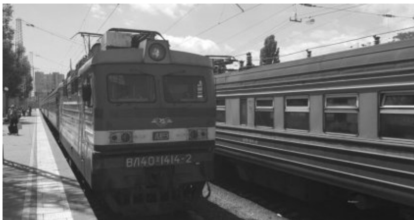
Unser Zug nach der Ankunft in Odessa

noch so ein abtrünniger Staat befindet. Und schon kurze Zeit nach dem Halt in der Transnistrischen Hauptstadt Tiraspol kamen die ukrainischen Zollbeamten in den Zug und wir waren in der Ukraine. Der Komfort im Zug war auch eher bescheiden, erinnerten die Holzbänke in den Wagen doch eher an den SBB-Standard in der dritten Klasse zu Beginn des 20. Jahrhunderts.