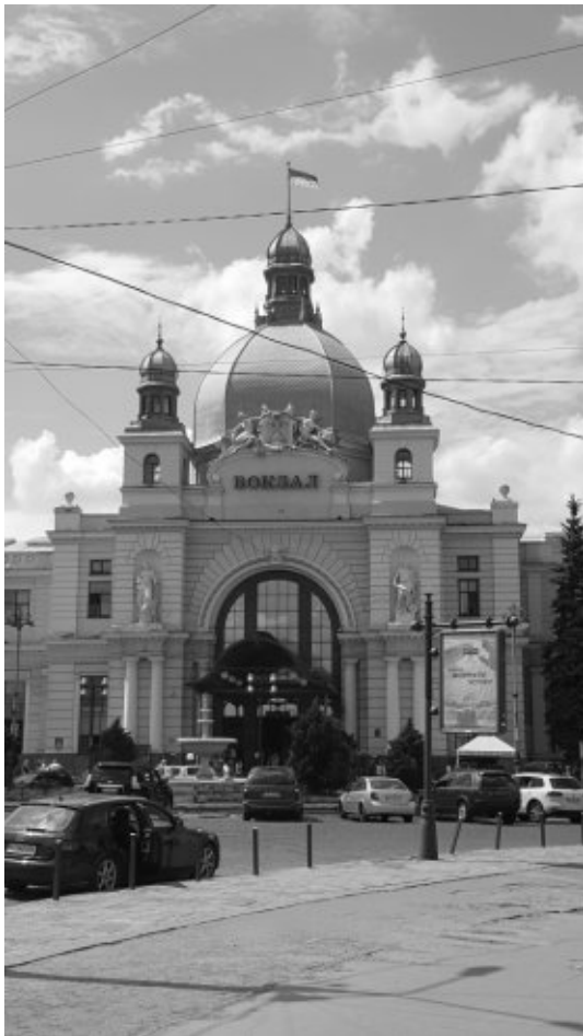
Der Hauptbahnhof von Lemberg

um auf dem Schienenweg zurück in die EU zu fahren und damit auch von der russischen Breitspur (1'520 mm) wieder auf die gewohnte westeuropäische Normalspur (1'435 mm) zurück zu wechseln. Der ukrainische Zug fuhr dabei bis nach Przemyśl in Polen. Dort stiegen wir nach kurzem Aufenthalt auf einen polnischen Intercityzug um, welcher uns bis nach Breslau (polnisch Wrocław) brachte. Zwischen Krakau und Oppeln musste unser Zug allerdings baustellenbedingt noch einen ziemlichen Umweg fahren. Da wir, als wir die eigentliche Strecke zwischen Krakau und Breslau erreicht hatten, verkehrt auf die Stre-