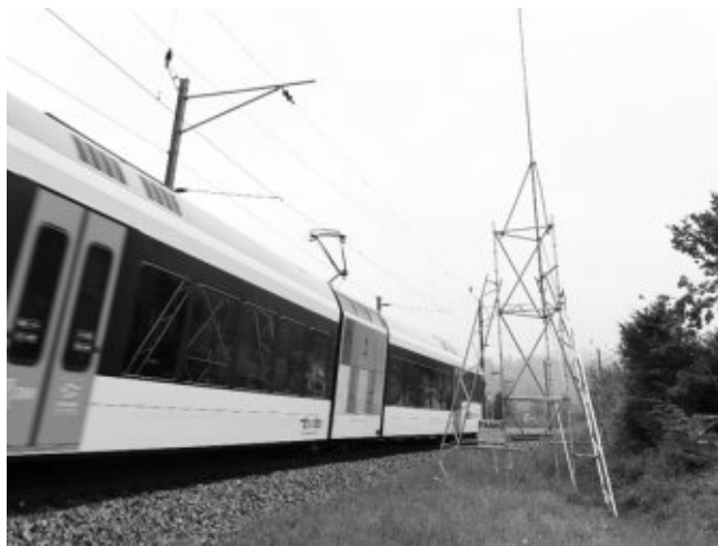
Baugespann GSM-Antenne

Der Bahnfunk wird unter anderen in Notfällen benötigt, beispielsweise zur Kommunikation zwischen Lokführer und Zentrale, wenn eine Barriere nicht schliesst oder ein Fahrzeug seinen Geist aufgibt. GSM-R ist ausserdem Voraussetzung für die Einführung des Zugsicherungssystems ETCS 2. ETCS 2 steht für European Train Control System Level 2. „Bei diesem Zugsicherungssystem werden dem Lokführer die Fahrerlaubnis, Geschwindigkeitsangaben und Streckendaten im Führerstand angezeigt. Ausser einigen Merktafeln kann daher auf eine Aussensignalisierung verzichtet werden (Führerstandssignalisierung). Die Bewegungen der Züge sowie die örtliche Höchstgeschwindigkeit, die Höchstgeschwindigkeit des Zuges, die korrekte Fahrtstrecke und die Fahrtrichtung werden von der Streckenzentrale dauernd überwacht.“ (siehe SBB, Zugsicherung ETCS)