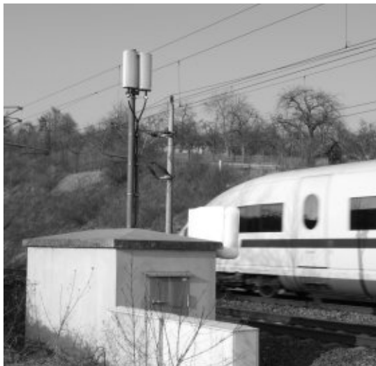
GSMR Indoor Marksteintunnel Ost

Gegen die Masten sind Einsprachen von Privaten und Gemeinden für die Standorte in Zell, Bauma, Fischenthal und Wald eingegangen. Gründe für die Einsprachen sind eine Verschönerung des Landschafts- bzw. Ortsbilds, aber auch die Strahlenbelastung. Der Landbote spekulierte bereits darüber, dass die GSM-R-Antennen schon bald obsolet werden könnten. Er bezieht sich dabei auf ein Pilotprojekt im Toggenburg zwischen Degersheim-West und Brunnadern. Dabei kommen statt Antennen Antennenkabel entlang der Bahnstrecke zum Einsatz. Dazu muss jedoch eine aufwändige Aufhängevorrichtung erstellt werden, welche ebenfalls das Landschafts- bzw.