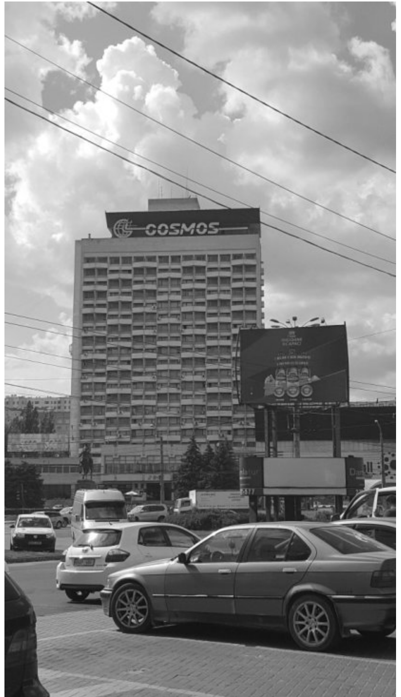
Hotel Cosmos Chişinau

unser Hotel stand, sondern hielt in einer Strasse, welche einige 100 Meter davon entfernt war. Aus diesem Grund machte sich die junge Frau sorgen, dass wir unser Hotel nicht finden. Als wir dann erklären konnten, dass es für uns kein Problem darstellt, das Hotel von der Haltestelle her zu Fuss zu erreichen, beruhigte sich die Diskussion in Bus allmählich wieder. Kurze Zeit später checkten wir dann im Hotel Cosmos ein. Das Gebäude spiegelt